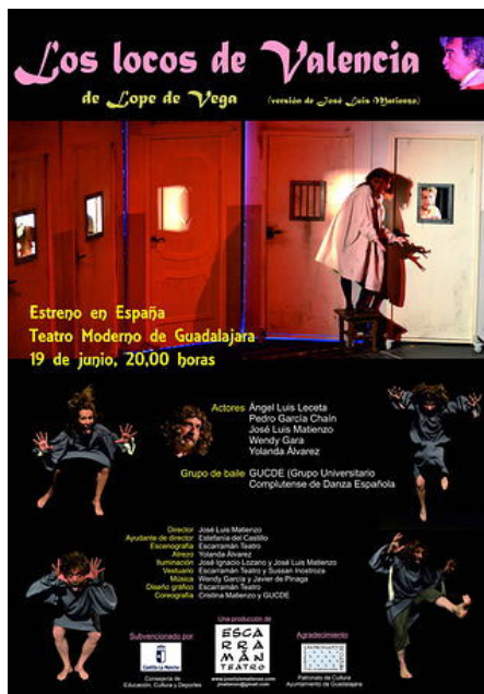
Los Locos de Valencia.